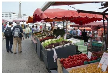
マーケット広場(カウツパトリ)