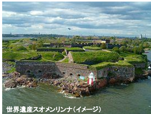
世界遺産スオメンリンナ(イメージ)