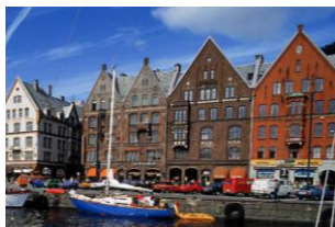
世界遺産:ブリッゲン地区

オスロフィヨルドを見下ろして広がるノルウェーの首都。画家ムンクや劇作家イブセンを生んだ芸術と文化の街です。現在も国王が暮らしている王宮などがあります。