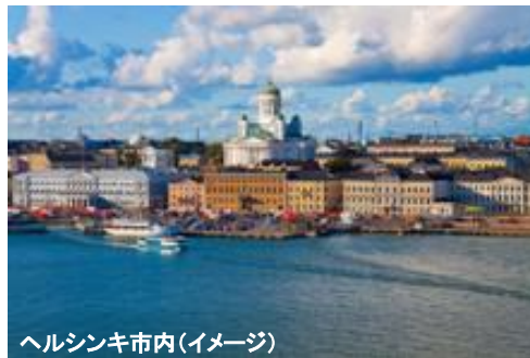
ヘルシンキ市内(イメージ)