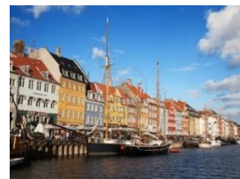
ニューハウンド地区