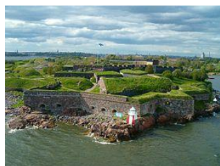
スオメンリンナ要塞