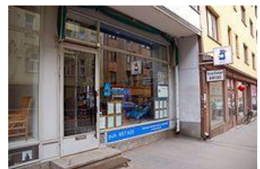
カハヴィラ スオミ (かもめ食堂)