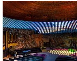
テンペリアウキオ教会