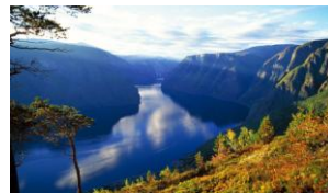
ソグネフィヨルド

紺碧の水を湛える水面と、そこへ突き刺すように聳え立つ断崖。今から100万年前、北欧は厚い氷河に覆われていました。それが膨れるにつれ、重みに耐えかねて、大地をすべり海へと押し流されていきました。蛇行する溪流のうねりは、気の遠くなるような年月をかけて氷河が刻印した浸食そのもの。フィヨルドという大自然の驚異とエネルギーが、航行する旅人の心を揺り動かします