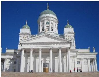
ヘルシンキ大聖堂

他国の主な首都と比べ、ヘルシンキの鼓動はゆったりとして緩やかです。市内の観光名所や人気スポットのほとんどは徒歩圏内にあります。公共交通機関は快適で信頼性が高く、ヨーロッパの中でも上位にランクしています。20世紀の独立後に建築界の第一人者によって建てられたモダンな建物が、ヘルシンキをヨーロッパ屈指の美しい街にしています。