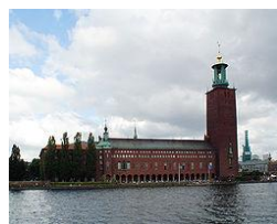
ストックホルム市庁舎

かつてはバルト海を航海する船が帆を休めた港町として栄え、今も運河沿いには昔の面影が漂っています。アンデルセンが好んだのはニューハウンド地区で、今はしゃれたレストランやカフェテリアが並ぶウォーターフロントです。